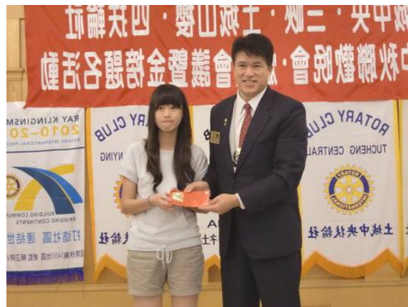
社長House頒發金榜題名