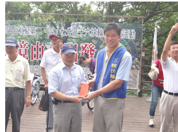
本社榮獲出席獎第二名