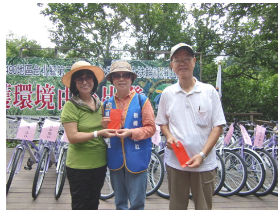
幸運的得獎社友Banker(左)、Insurance(右)