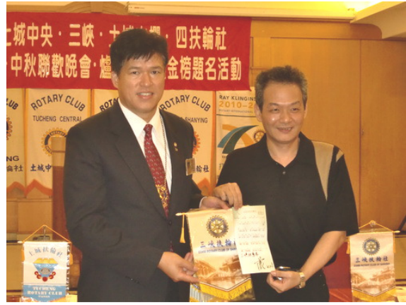
社長House致贈小社旗予主講者