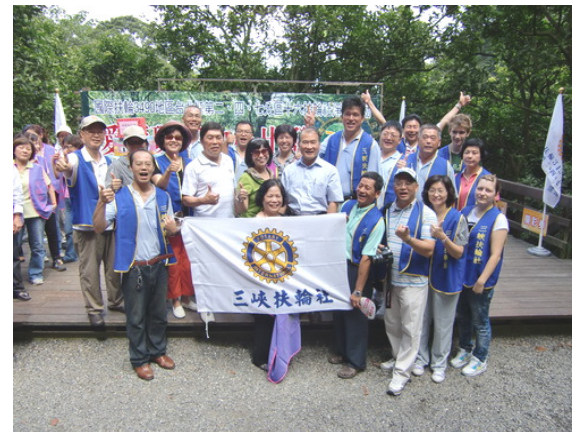
社友們與總監伉儷合影