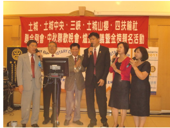
助理總監、地區副秘書、四社社長歡唱在一起