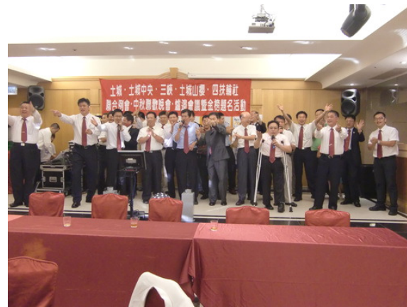
社友們歡唱在一起