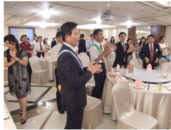
慶祝社長House上任，大家歡唱在一起