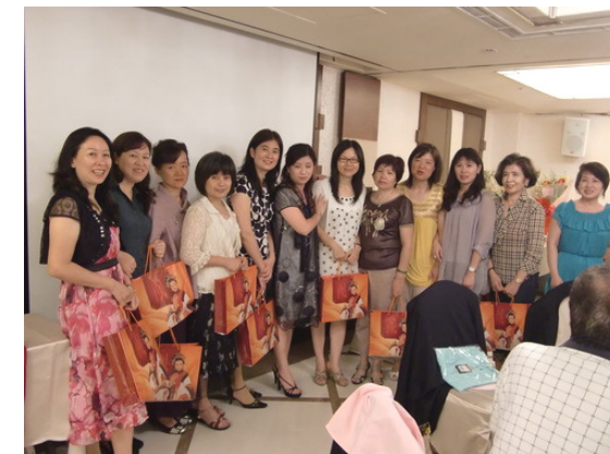
社長夫人贈送夫人們手工鳳凰酥