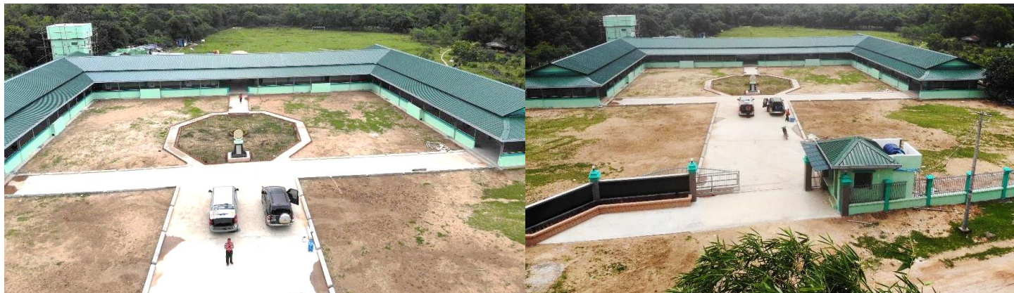
【柏固甘尼小學 捐贈啟用典禮】典禮結束後，前往...