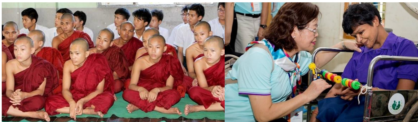
【孤兒院或弱勢團體】進行參觀，傍晚前往...